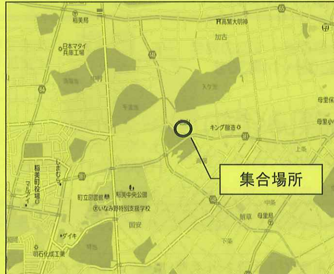
④ JA兵庫南稲美営農経済センター駐車場