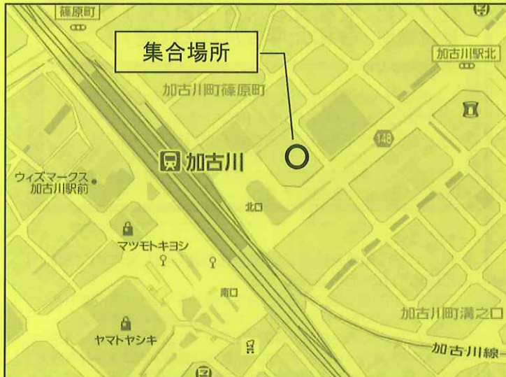
② 加古川駅北自動車整理場