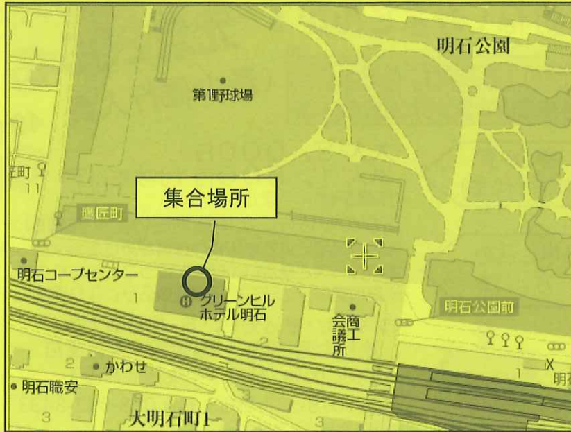
① グリーンヒルホテル明石神姫バス駐車場